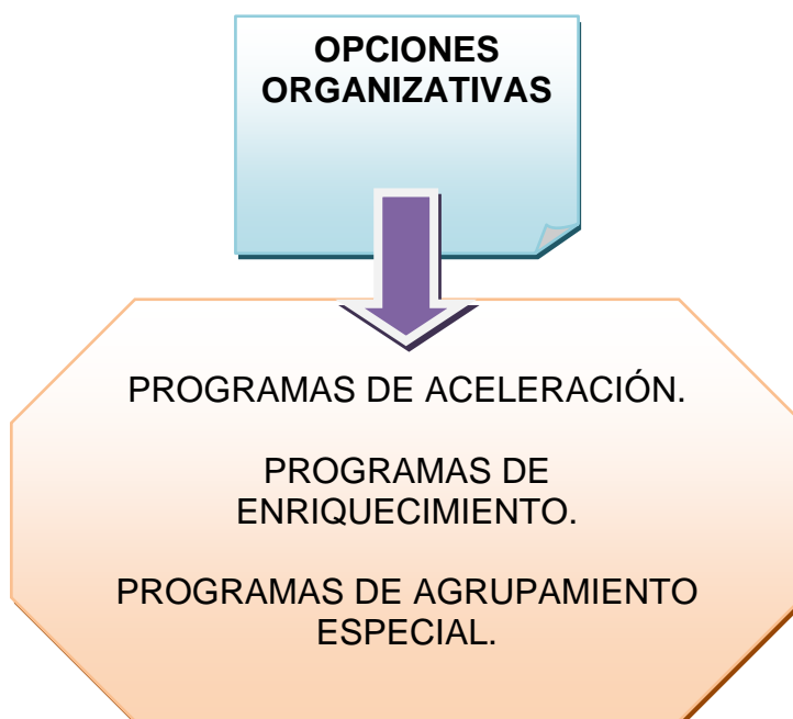
Esquema nº 1. Diferentes opciones organizativas para alumnos/as con altas capacidades intelectuales.

Podemos agrupar los programas para los estudiantes muy capacitados en tres modelos (Alonso y Benito, 2004):