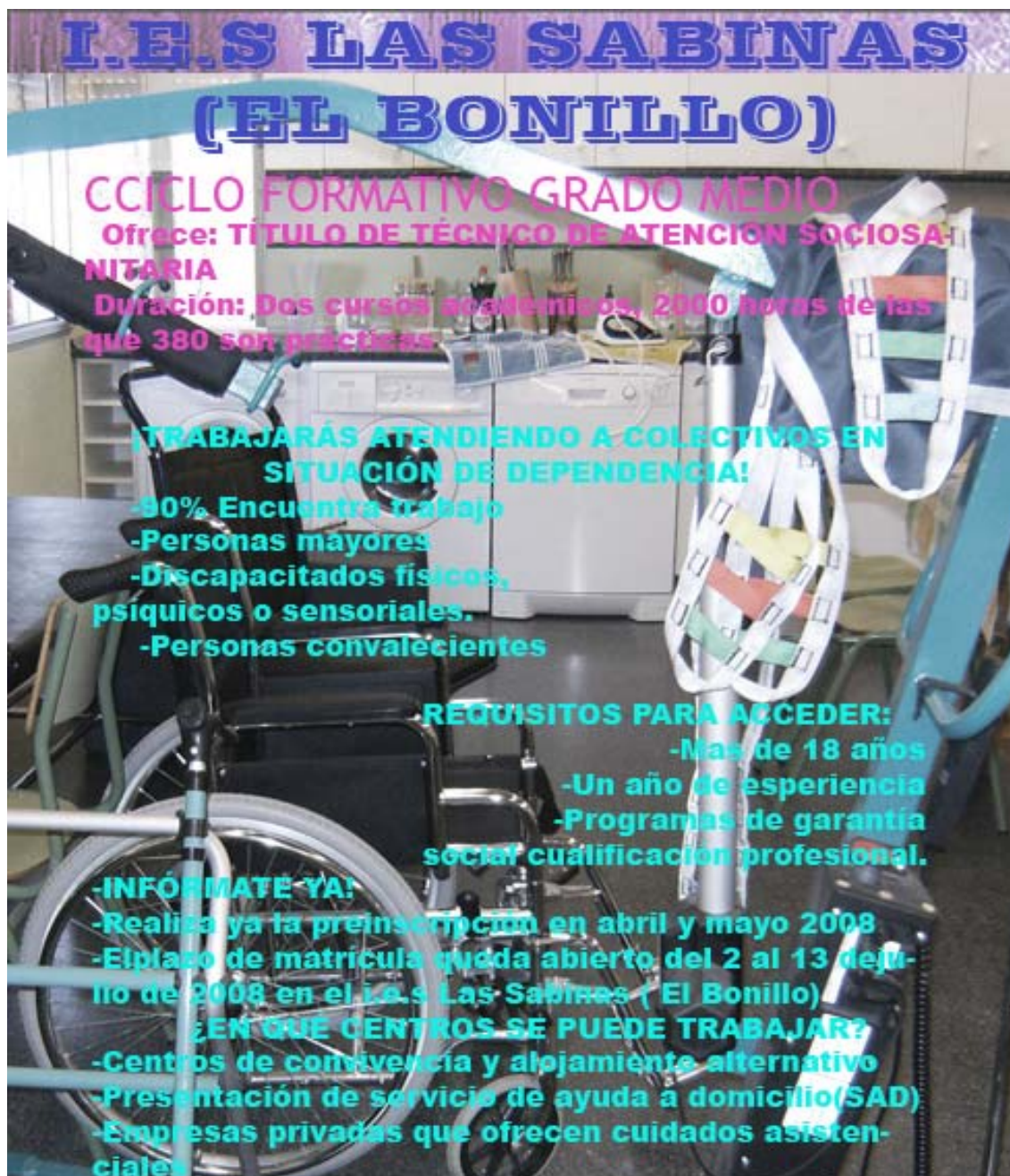
Poster publicitario 1