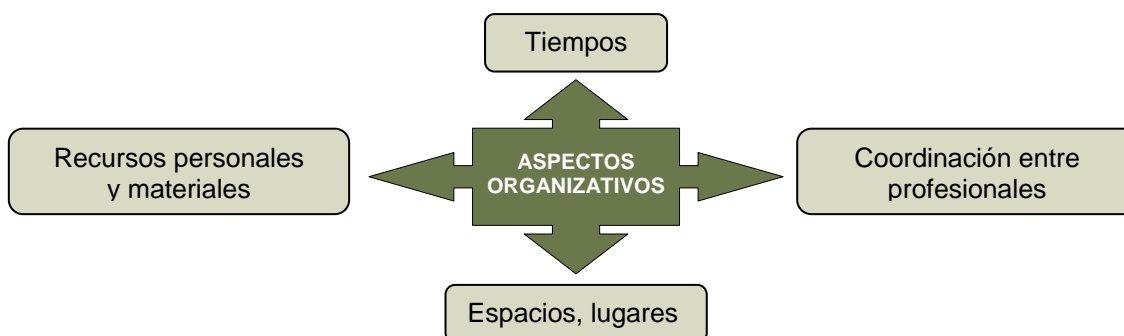
Esquema 1. Recursos organizativos

Los aspectos organizativos tienen que ver con la necesidad de establecer espacios de atención educativa, lugares comunes a todos los estudiantes o diferenciados para los alumnos con necesidades educativas específicas, o definir cuándo y en qué momentos se prestarán los apoyos, refuerzos o adaptaciones para conseguir los objetivos educativos. Se contemplan, así mismo, los recursos personales y materiales requeridos en cada caso, así como la coordinación necesaria entre todos los profesionales que intervienen con cada estudiante.