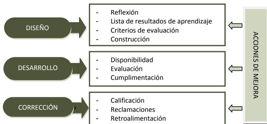
Figura 2. Recomendaciones para la aplicación de rúbricas en las prácticas de laboratorio

han recopilado los puntos considerados como críticos para la correcta puesta en marcha de las rúbricas en unas prácticas de laboratorio universitarias.